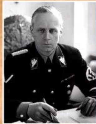
Иоахим фон Риббентроп