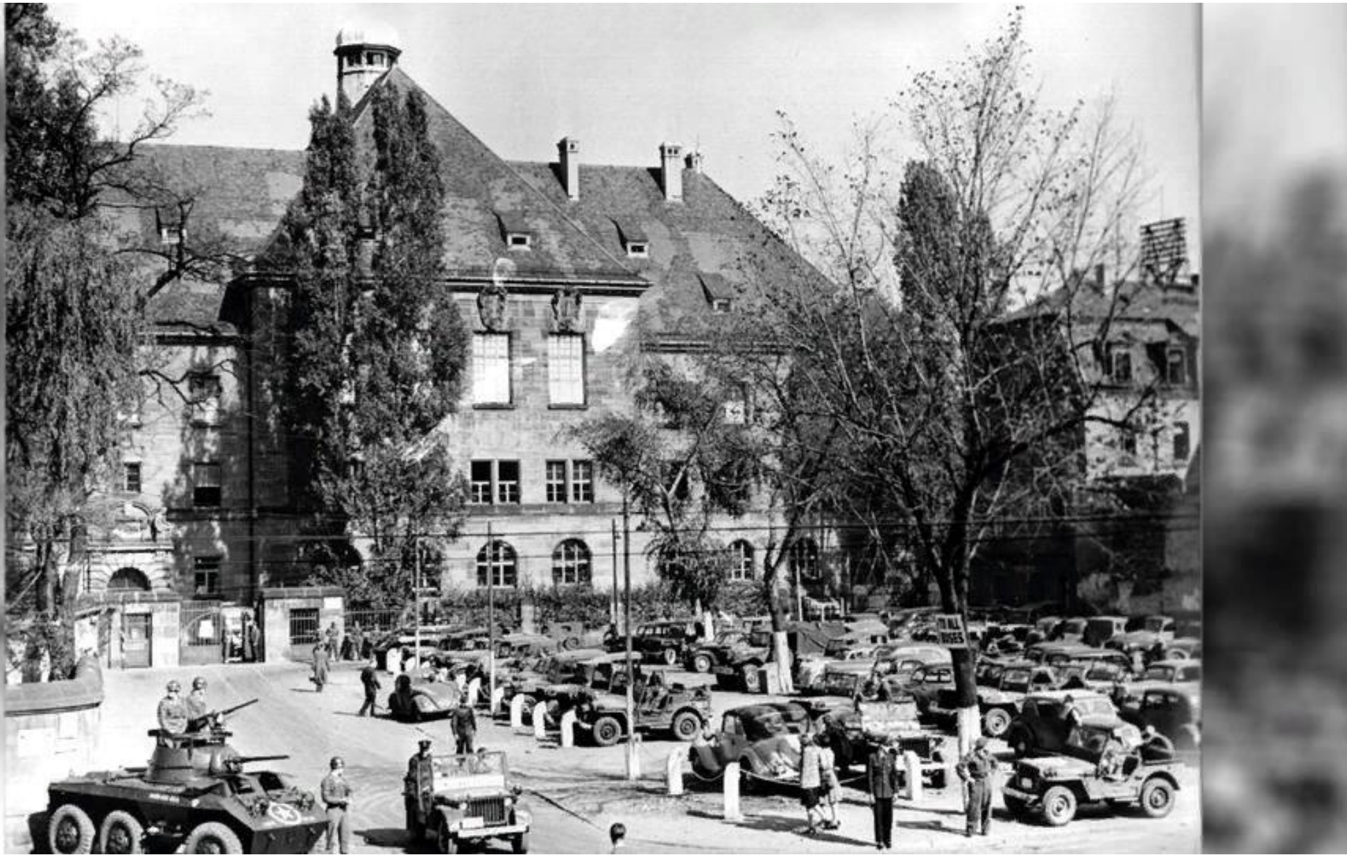
Нюрнбергский дворец правосудия, 20.11.1945-1.10.1946