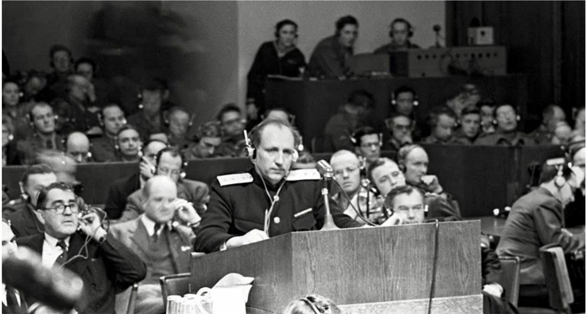
Генеральный прокурор СССР (1953-1981)