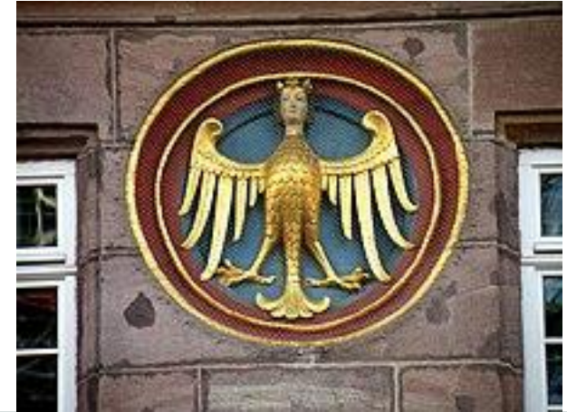
Нюрнберг. Рыночная площадь (Hauptmarkt)