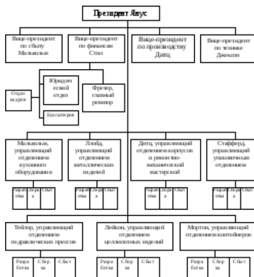
Рис. 1. Организационная структура фирмы «Сигма»

Кроме того, было проведено объединение всех работников, связанных со снабжением, в централизованный отдел снабжения в подчинении вице-президента по производству. Созданы централизованная бухгалтерия и отдел обслуживания. Централизация однородных функций осуществлялась в целях экономии на постоянных расходах в результате увеличения масштабов производства.