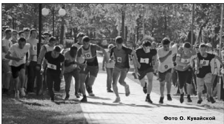
Фото О. Кувайской