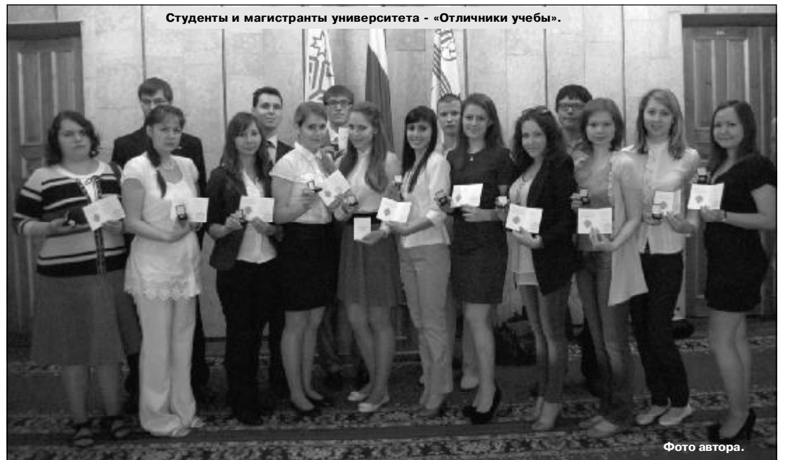
Студенты и магистранты университета - «Отличники учебы».