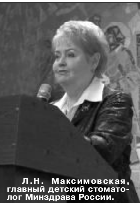
Л.Н. Максимовская, главный детский стоматолог Минздрава России.