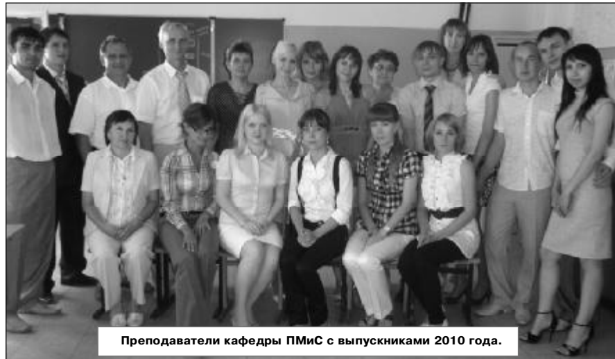
Преподаватели кафедры ПМиС с выпускниками 2010 года.

бель», ОАО «Чебоксарский агрегатный завод», ОАО «ЧЭАЗ», ОАО «Электроприбор», ООО «Хевел», ОАО «Элара», РФЯЦ-ВНИИЭФ (Саровский ядерный центр) и многих других. Отличительная особенность кафедры заключается в том, что она выпускает специалистов в области метрологии и управления качеством, которые имеют превосходную подготовку и по техническим дисциплинам: «Теория машин и механизмов», «Детали машин и основы конструирования», «Сопротивления материалов», «Автоматизация испытаний, измерений и контроля» и многим другим.