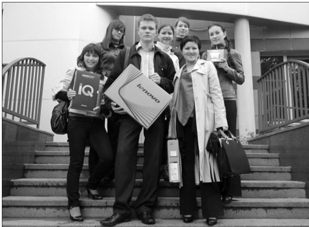
Завершилась республиканская олимпиада «Со студенческой скамьи – в кресло профессионала», в которой удачно выступили студенты экономического и юридического факультетов ЧГУ. На фото – команда экономистов. Стр. 2.