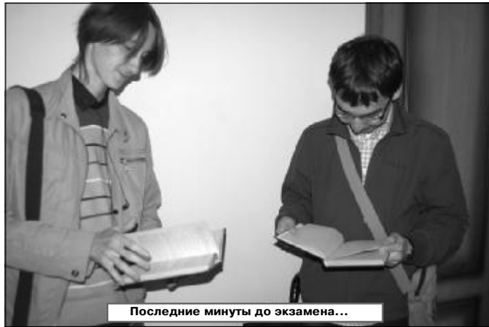
Последние минуты до экзамена...