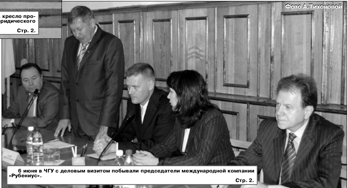
6 июня в ЧГУ с деловым визитом побывали председатели международной компании «Рубениус». Стр. 2.

Теперь wi-fi в корпусе «Г» Чувашского госуниверситета доступен абсолютно всем. Для подключения не надо оставлять заявку, достаточно лишь иметь устройство, поддерживающее данный протокол передачи данных.