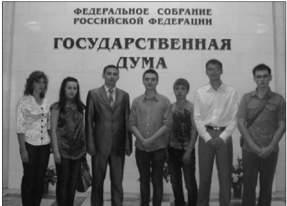
В Государственной Думе Российской Федерации состоялась встреча делегации Чувашского регионального отделения Российского союза сельской молодежи с депутатами Госдумы, в которой приняли участие и студенты ЧГУ. Стр. 2.