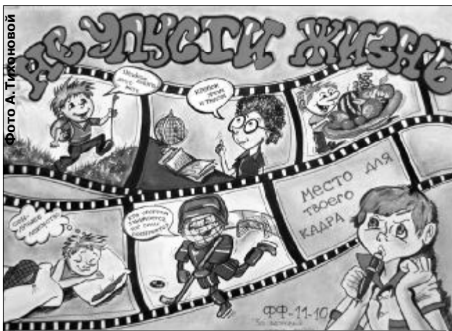
В конкурсе студенческих стенгазет «Мы за здоровый образ жизни» победу одержала группа ФФ-11-10.