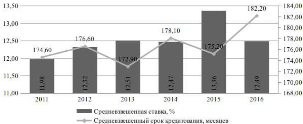
Рис. 3. Динамика средневзвешенной процентной ставки и срока ипотечного кредита за 2011-2016 гг.

Приложения помещаются в конце работы. Каждое приложение должно начинаться с нового листа с указанием в правом верхнем углу слова «Приложение» и иметь тематический заголовок. Приложения нумеруются арабскими цифрами (без знака «№»), например: «Приложение 3». Связь основного текста с приложением осуществляется посредством ссылок, например: (см. приложение 3).